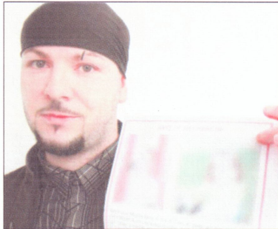
L'été dernier, le papa avait placardé cet avis de recherche à travers le Valais.

Garde retirée à la mère. En septembre 2009, le Tribunal d'arrondissement de l'Est vaudois a retiré provisoirement la garde des deux enfants à leur mère et confié ces derniers à l'Office pour la protection de l'enfant à Sion. C'est la justice vaudoise qui est intervenue en premier car le couple vivait à Bex avant de se séparer. «La maman a emporté nos enfants de me voir